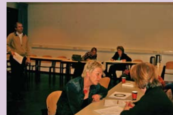
Samen aan de slag