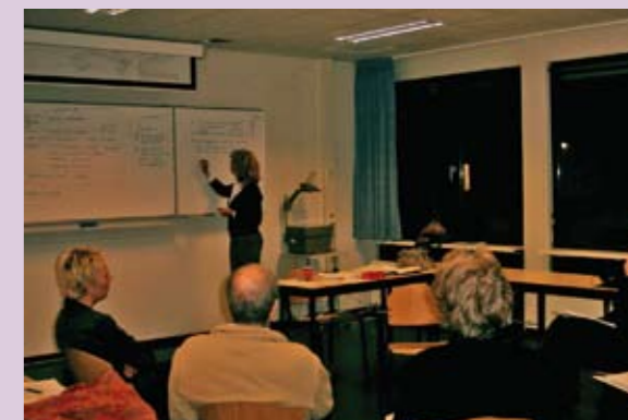
Theoretische onderbouwing vooraf